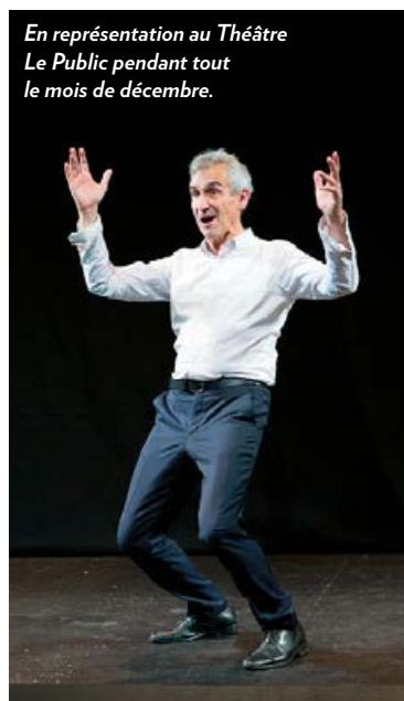
En représentation au Théâtre Le Public pendant tout le mois de décembre.

Une recette ? « On dit qu'il faut rire de tout, un peu tous les jours, et c'est parfaitement exact. » Parole de privilégié insouciant ? Il ne faut pas comprendre que « Monsieur Virgule » n'aurait plus